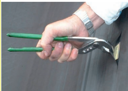
Posizionamento dei Tag.