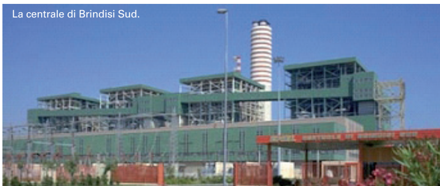
La centrale di Brindisi Sud.

In alternativa alle altre collaudate tecniche per l'identificazione automatica come il codice a barre o la banda magnetica, la tecnologia RFID offre sicuramente una migliore flessibilità d'utilizzo unita alla capacità di memorizzare e leggere dati e informazioni utili alla gestione automatica dei processi produttivi, alla loro manutenzione, al controllo di qualità e alla tracciabilità di cose o persone. La sperimentazione avviata nella centrale di Brindisi Sud applicata ai sistemi di movimentazione del carbone permetterà di raccogliere maggiori informazioni circa l'affidabilità dei sistemi di lettura e la resistenza meccanica dei Tag, così da definire le caratteristiche finali dei sistemi e l'applicazione alle normative in vigore. In futuro, questa tecnologia potrebbe trovare applicazione anche come supporto al personale di manutenzione per ottimizzare la gestione degli interventi e rendere intelligenti i dispositivi più critici del sistema di trasporto, consentendo la memorizzazione del loro stato di funzionamento. ■