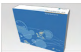
SkyeModule™ DKM9 OEM Developer Kit

In particolare, tra i dispositivi SkyeTek spicca il Multiprotocol RFID UHF Reader Module M9 oltre ad una gamma completa di Developer Kit e accessori (HF & UHF) basati sulla medesima piattaforma di sviluppo e totalmente compatibili a livello HW e SW concretizzando la filosofia easy-to-integrate.