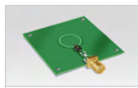
UHF Inductive Antenna Antenna UHF