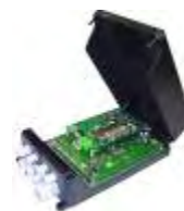
Controller UHF Gen2