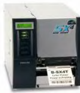
Stampante RFID B-SX