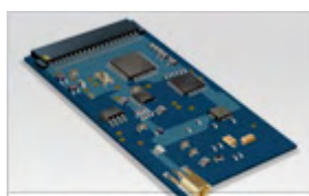
SkyeModule™ M9 OEM UHF Module