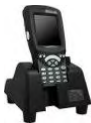
WorkAbout PRO RFID by SOFTWORK

SOFTWORK ha siglato un accordo di distribuzione e cooperazione con la società franco-canadese Psion Teklogix , azienda specializzata nell'elaborazione mobile e nella raccolta dati di tipo wireless e produttrice di terminali mobili industriali.