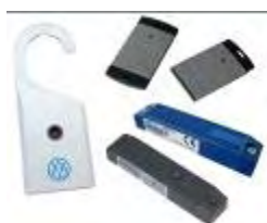
Transponder RFID Attivi

La società austriaca con la sua tecnologia RFID Attiva nella gamma UHF (868-915 MHz) è specializzata in sistemi di identificazione, localizzazione ricerca e tracciabilità di container, mezzi ed imballaggi in grandi aree di movimentazione