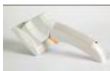
Hand Held BlueTooth

La vasta gamma degli apparati FEIG (controller, antenne e accessori) e l'integrazioni dei dispositivi progettati da SOFTWORK consentono di dare adeguata risposta alla crescente domanda di soluzioni in tutti i settori applicativi della tecnologia RFID.