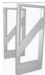
Gate Long Range