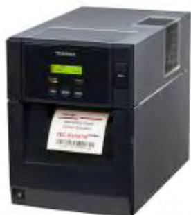
Stampante RFID B-SA

Meritevoli di nota sono il comando "Head Up" sviluppato da Toshiba per proteggere il sensibile e costoso circuito integrato delle Smart Labels e le funzionalità SNMP (Simple Network Management Protocol), che consentono agli operatori abilitati di controllare lo stato delle stampanti connesse in rete, modificarne le configurazioni ed eventualmente aggiornare il firmware delle stesse da qualunque postazione di rete.